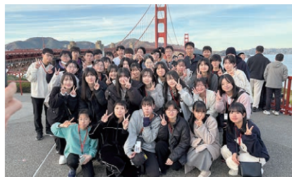
ゴールデンゲートブリッジ