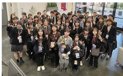
企業訪問Plug and Play