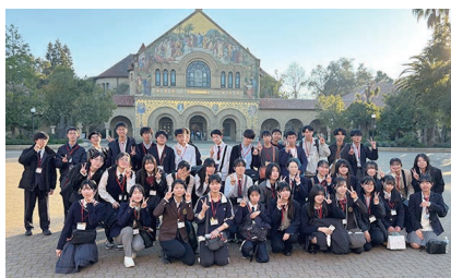
スタンフォード大学