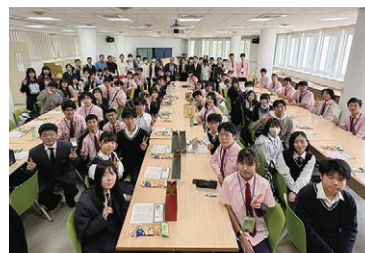
国立新竹科学園区実験高級中等学校